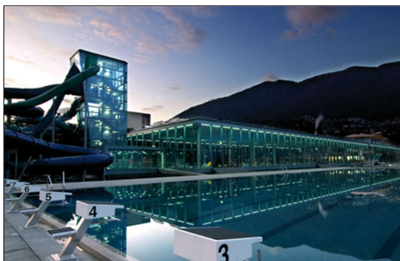
Piscina olimpionica 50 m