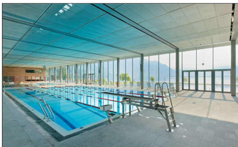
Piscina interna 25 m