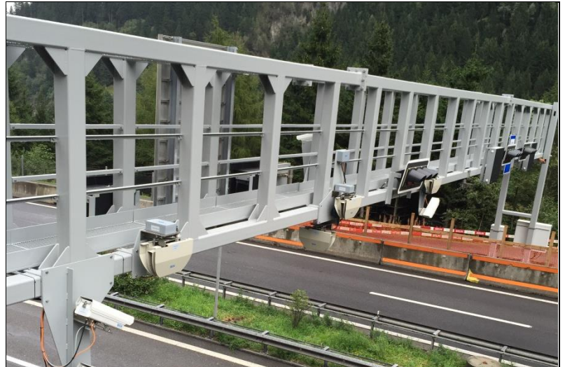
Sensorik des Thermoportals Göschenen