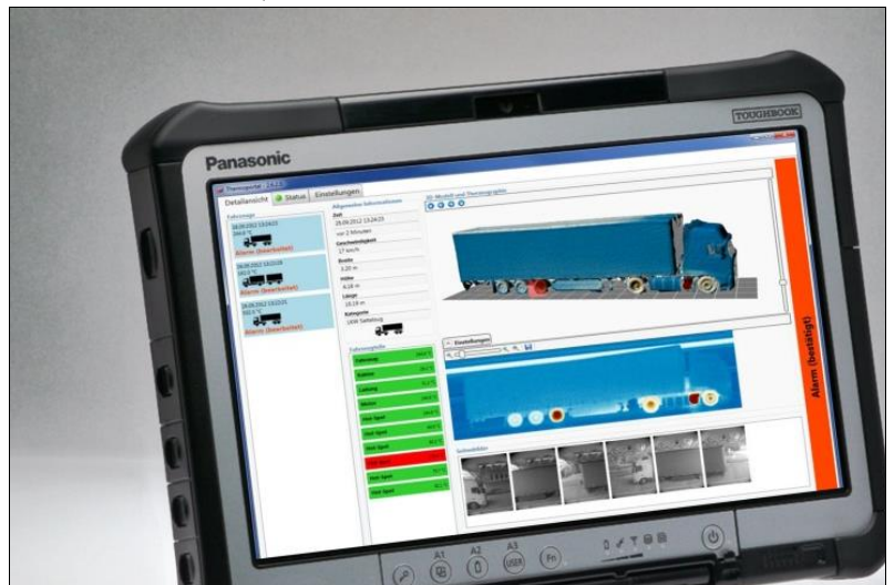
Mobiles Terminal zur Anzeige der Alarme