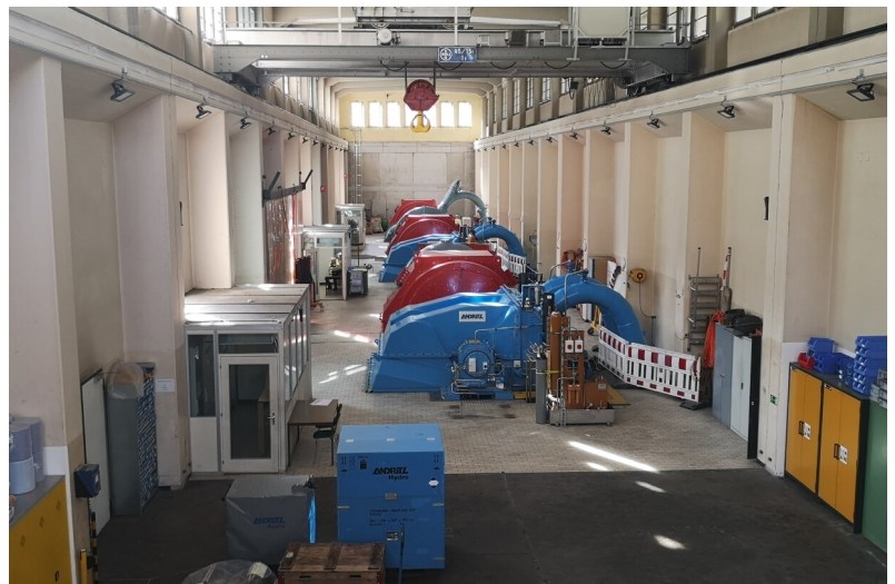
Sala macchine con i generatori