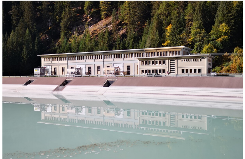
Vista della centrale dall'esterno

Forces Motrices de la Gougtra (FMG) (VS)