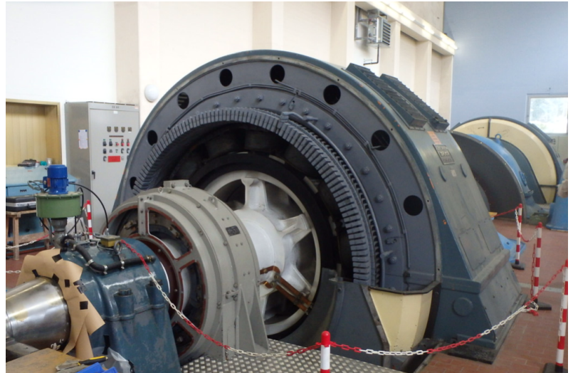
Alternatore attuale Gruppo 2