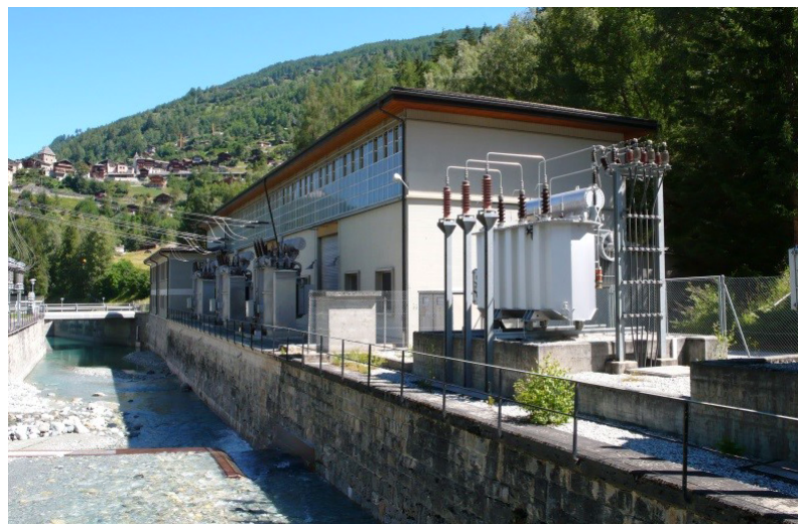
Centrale di Vissoie