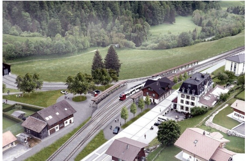
Gare de Montbovon – état futur

Ce mandat s'inscrit dans le contexte général du renouvellement de la gare et des installations existantes pour garantir une exploitation optimale de la ligne au cours des prochaines décennies.