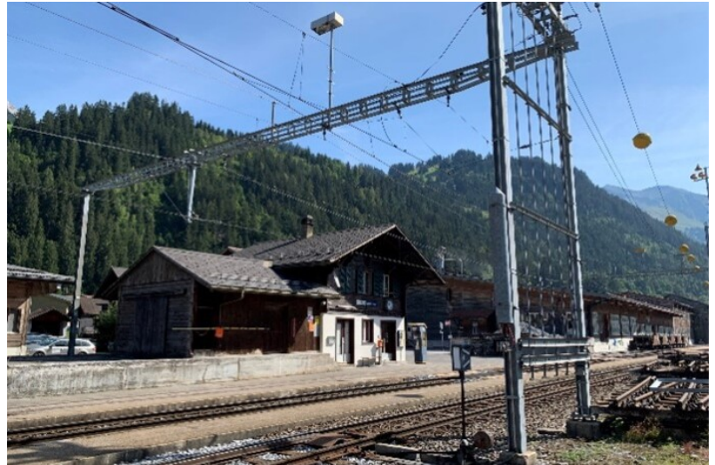
Batiment de gare existant

L'activité de planification a été dirigée dès l'étude des variantes et a progressé avec d'autres bureaux d'études pour le maître d'ouvrage. Actuellement, la phase 32 - projet de construction - est en cours de réalisation.