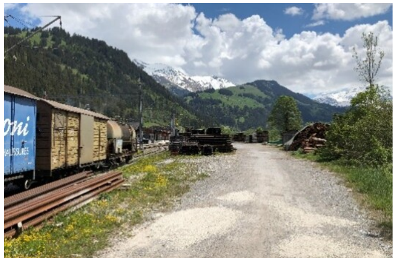
Surface de la future zone de débord avec voie de chargement