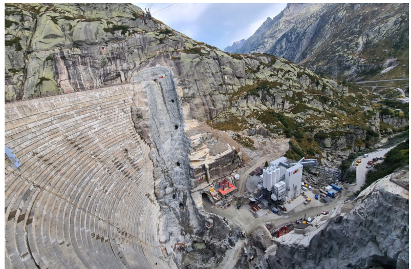
Poste d'installation de l'agneau d'hôpital