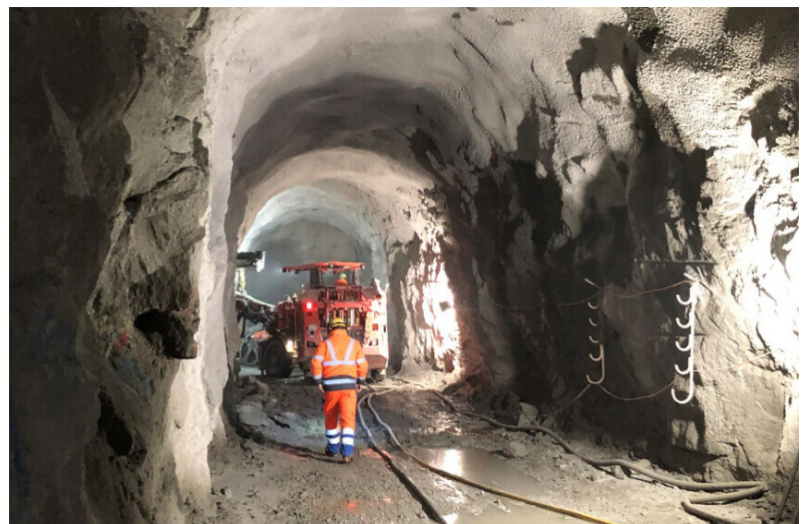
Galeries d'accès Chambre d'appareillage Agneau d'hôpital