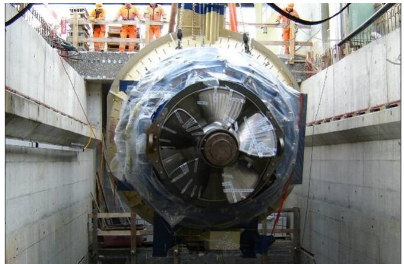
Montage der fertigen Rohrturbine in die im Rohbau erstellte neue Zentrale