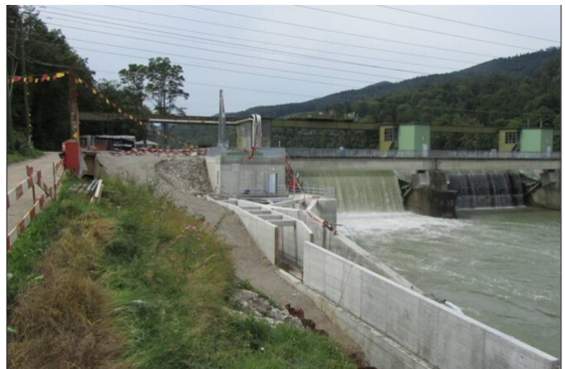
Fertiggestelltes Dotierkraftwerk mit Fisch-Einstiegs-galerie und Vertical-Slot-Fischpass