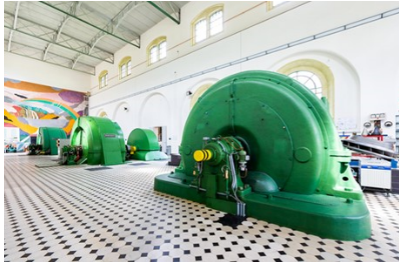
Vecchia centrale di Robbia, vista interna prima della trasformazione