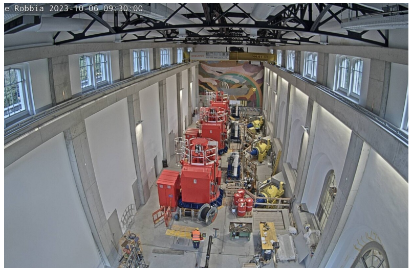
Montaggio condotte ad anello e alloggiamento delle turbine