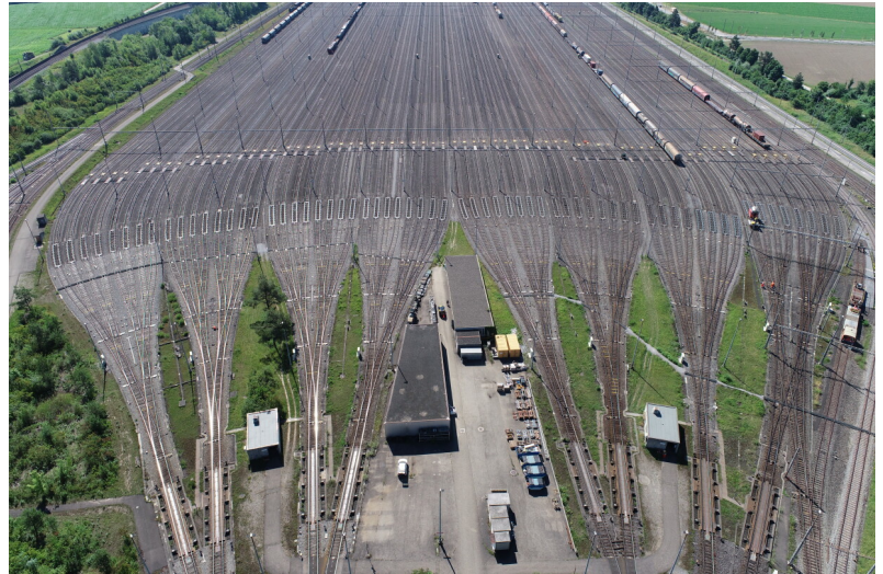
RBL Ovest con binari direzionali e vista verso RBL Est (Dietikon)