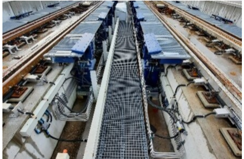
Vues des deux rampes à Zweisimmen, prêtes à l'emploi

Afin de changer l'écartement de ces bogies sans stopper le train, une installation spécifique, appelée rampe à écartement variable, a été conçue et installée à Zweisimmen. En 2019. En 2022, une seconde rampe a été construite à des fins de redondance du système.