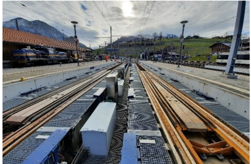
Gleis 6 und 7. Position Normalspur - BLS

Sowohl die Zusammenarbeit dieser Komponenten als auch die zugehörigen Betriebsprozesse sind einzigartig. Diese innovativen Elemente in einer einmaligen Konfiguration bedingen einen komplexen und zeitkritischen Zulassungsprozess mit dem BAV.